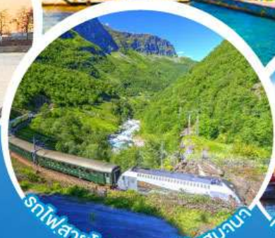
รถไฟสายโรแมนติกฟลินส์บานา