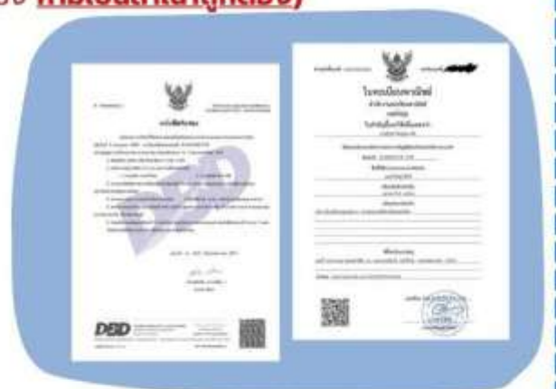
ตัวอย่างหนังสือจดทะเบียนบริษัทฯ และ ใบทะเบียนพาณิชย์