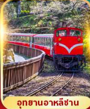
อุทยานอาหลิซาน