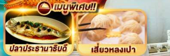
ปลาประธาราธิบดี