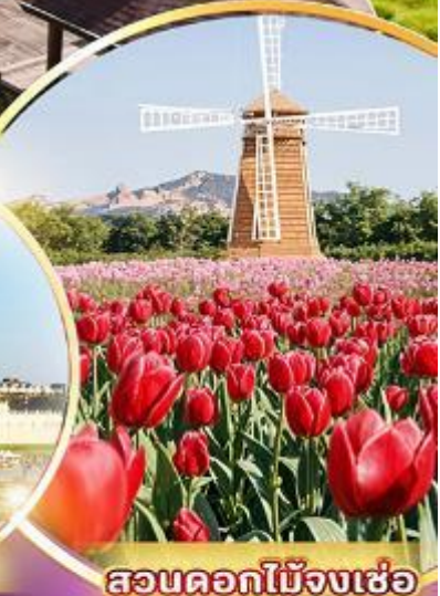
สวนดอกไม้เมืองเซ่อ