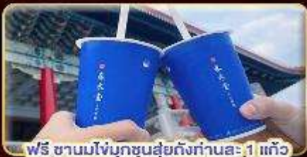
ฟรี ชานมไข่มุกชงสดถึงท่านละ 1 แก้ว