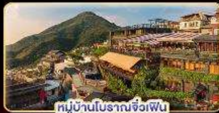
หมู่บ้านโบราณจื่อเฟิน