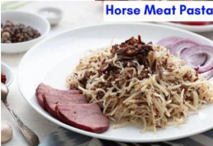
Horse Meat Pasta