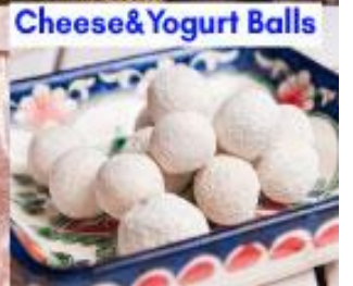
Cheese & Yogurt Balls