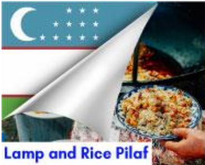
Lamp and Rice Pilaf