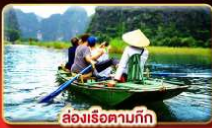
ล่องเรือตามกีก