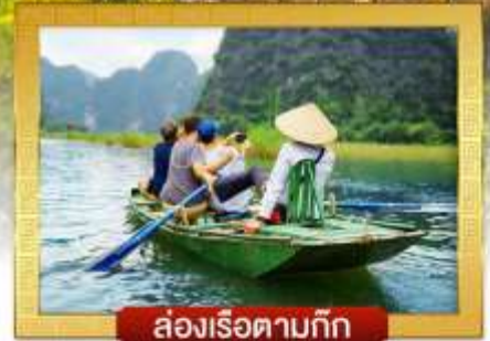
ล่องเรือตามก๊ก