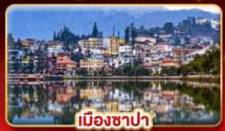
เมืองซาปา