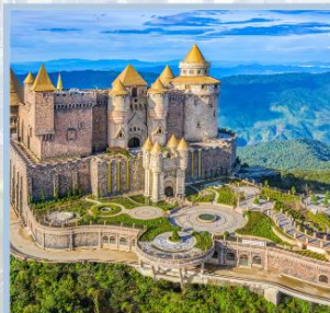
ปราสาทจันตรา