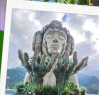
Moana Cafe Sapa