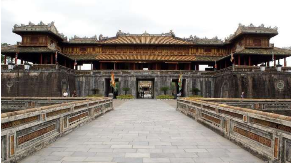
นำท่านนั่งรถ รถสามล้อซีโคล (Cyclo) ชมเมืองเว้ ซึ่งเป็นเอกลักษณ์ของประเทศเวียดนาม (ไม่รวมค่าทิป)