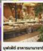
บุฟเฟ่ต์ อาหารนานาชาติ