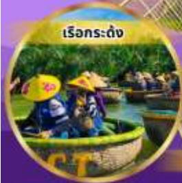
เรือกระดง