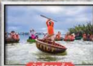
นิงเหวอกระดิง