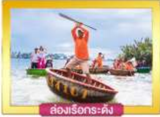
ล่องเรือกระดิง