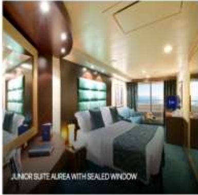
JUNIOR SUITE ALREA WITH SEALED WINDOW