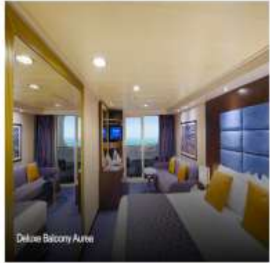
Deluxe Balcony Alrea