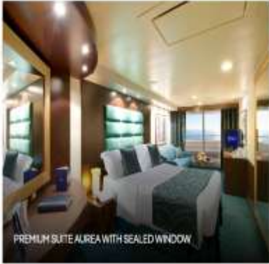
PREMIUM SUITE ALREA WITH SEALED WINDOW