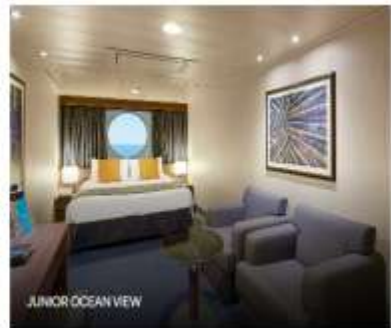
JUNIOR OCEAN VIEW